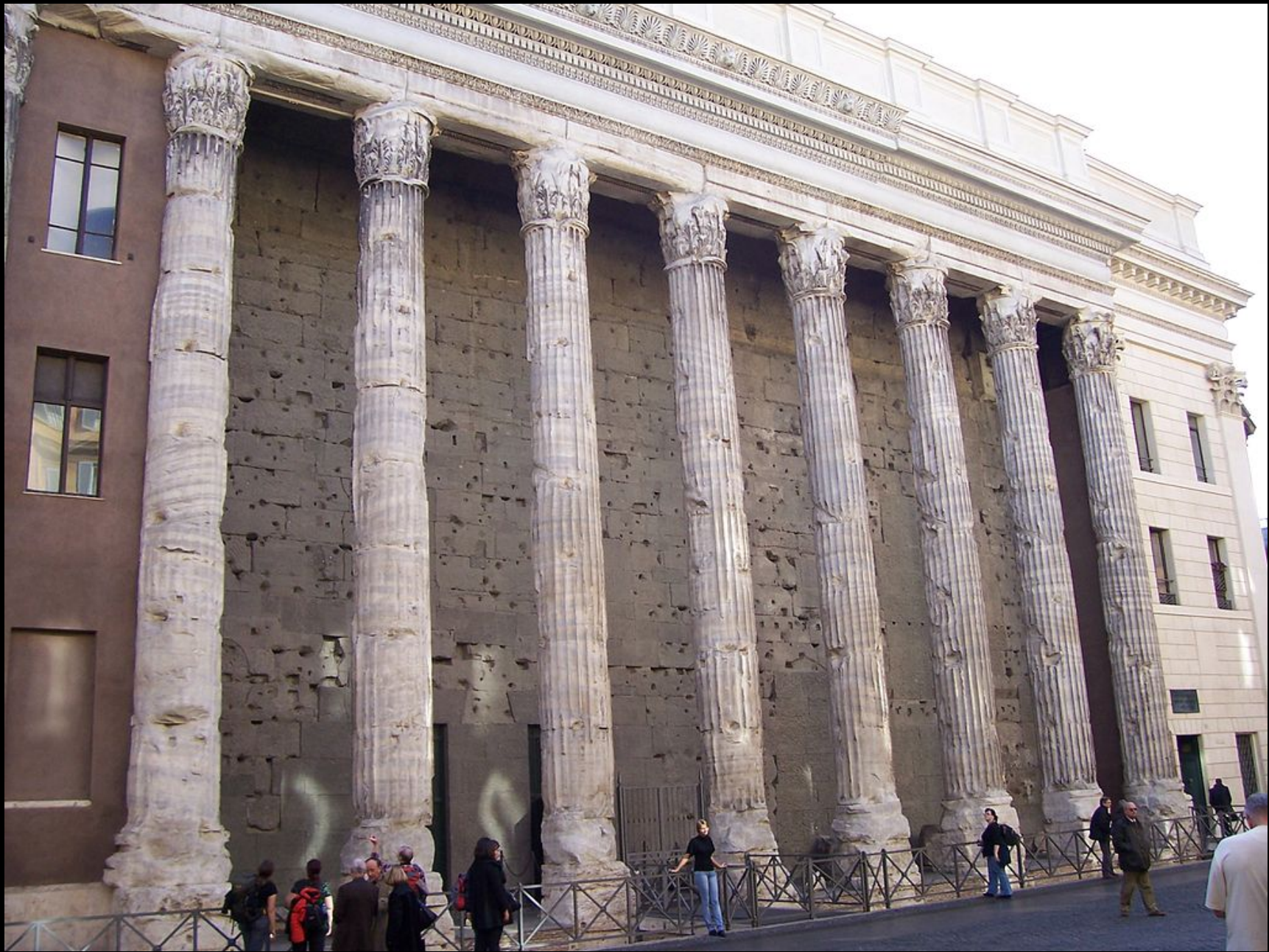
Roma, Tempio di Adriano (II sec. d.C.) in Piazza di Pietra