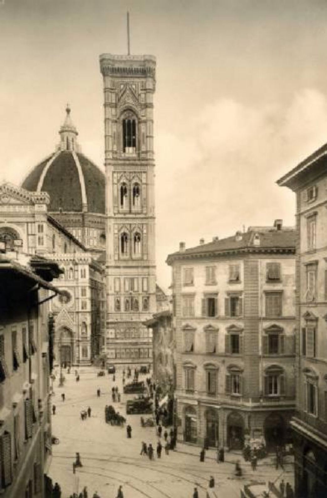
Giotto, campanile del Duomo (1334-1337, Firenze) (foto realizzata tra il 1900 e il 1924)