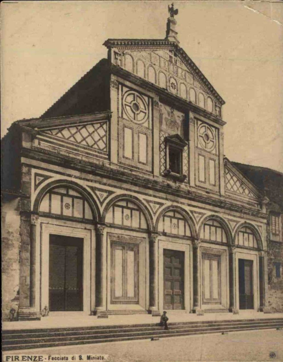
San Miniato al monte, facciata (c. 1090, Firenze) (cartolina realizzata tra il 1900 e il 1914)