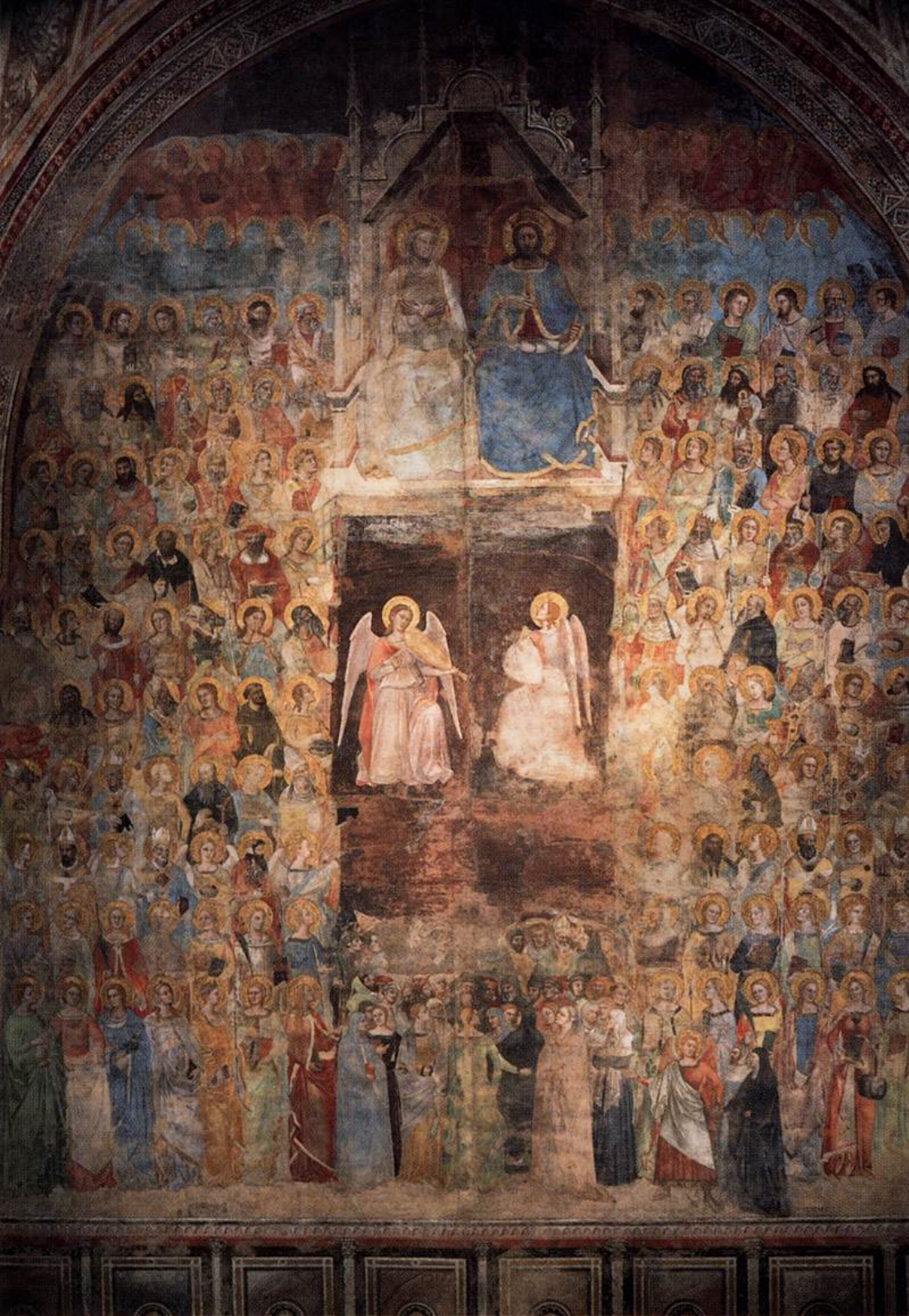
Nardo di Cione, Paradiso (1354-1357, Cappella Strozzi, Santa Maria Novella, Firenze)