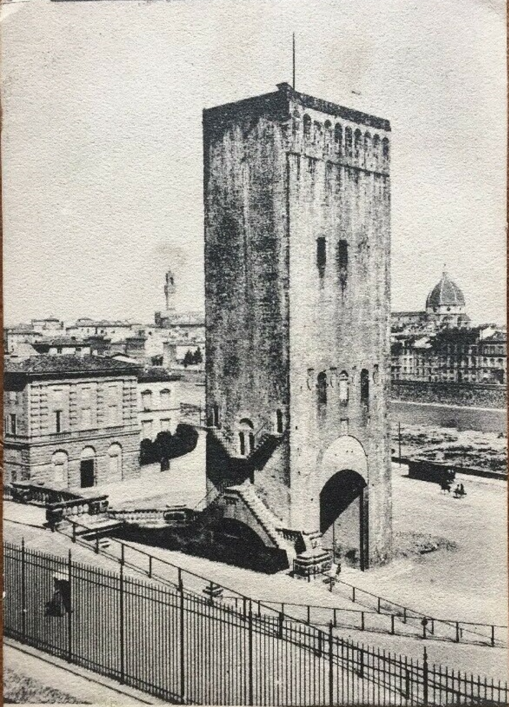
Firenze - Torre di S. Nicolò 2 Aprile 1907 Lepidi

6900 - Garzini e Pezzini - Milano - 1907.