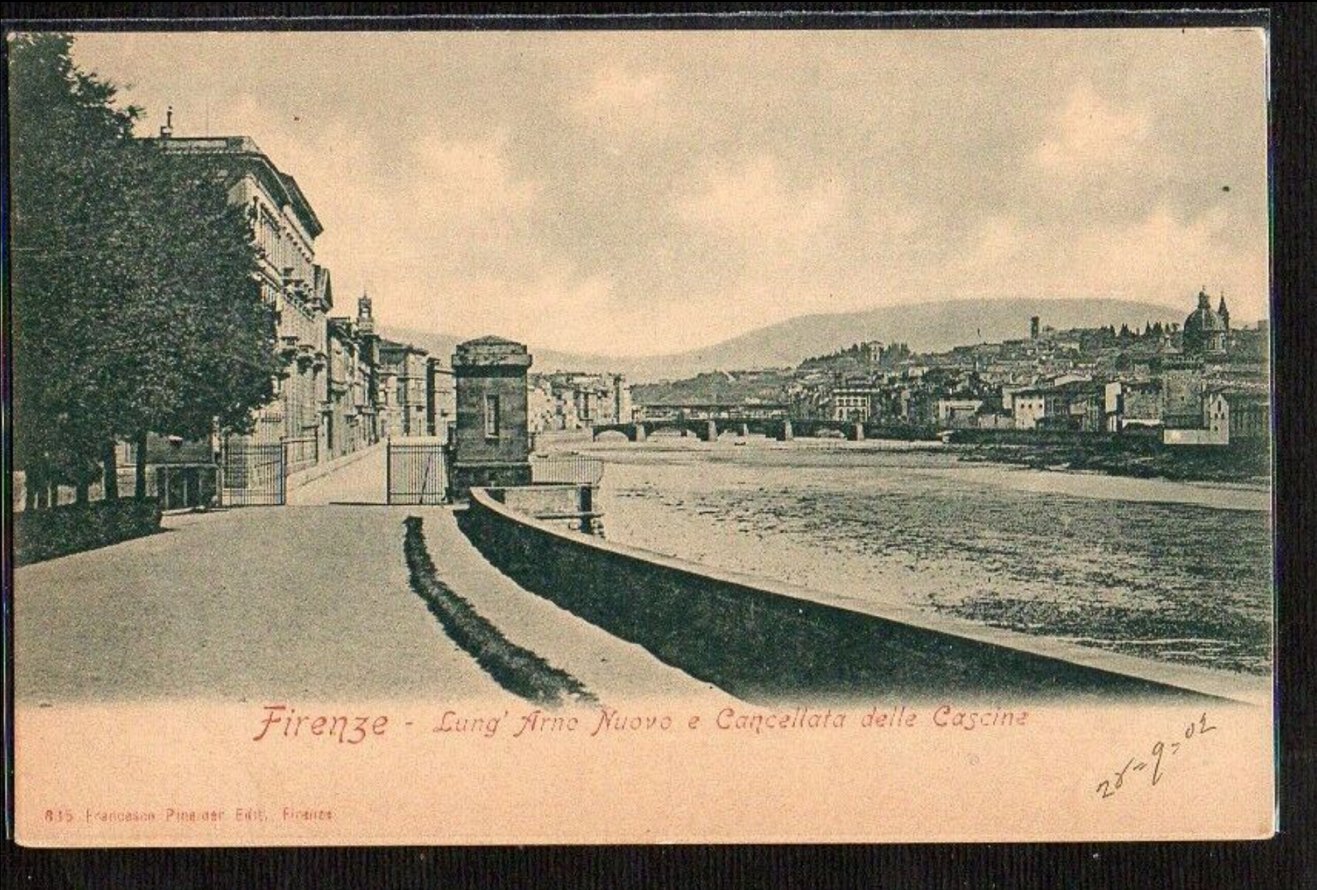
Firenze, panorama del Lungarno Nuovo (cartolina datata 1901)