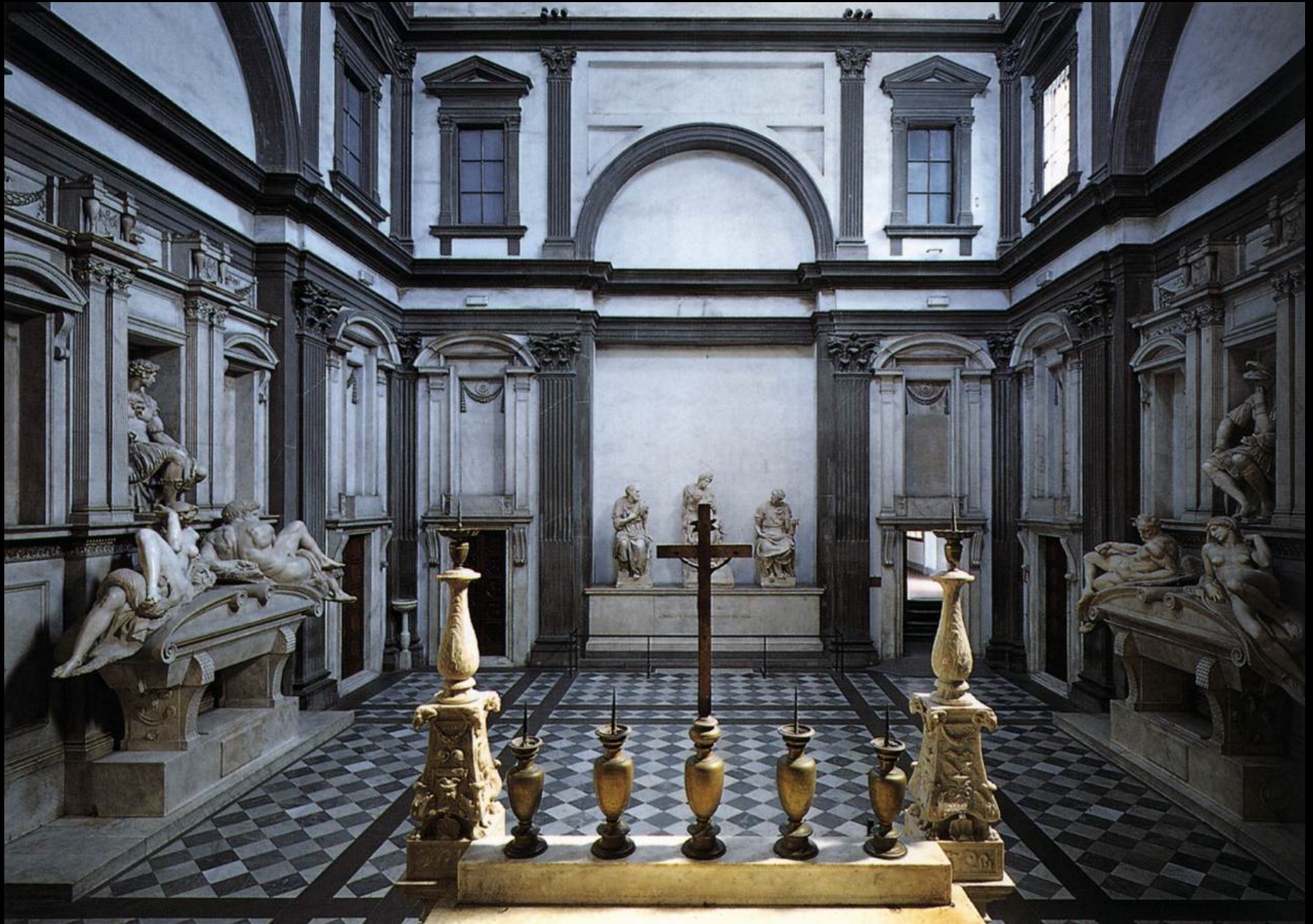
Michelangelo, Cappella medicea (1526-1533, San Lorenzo, Firenze)