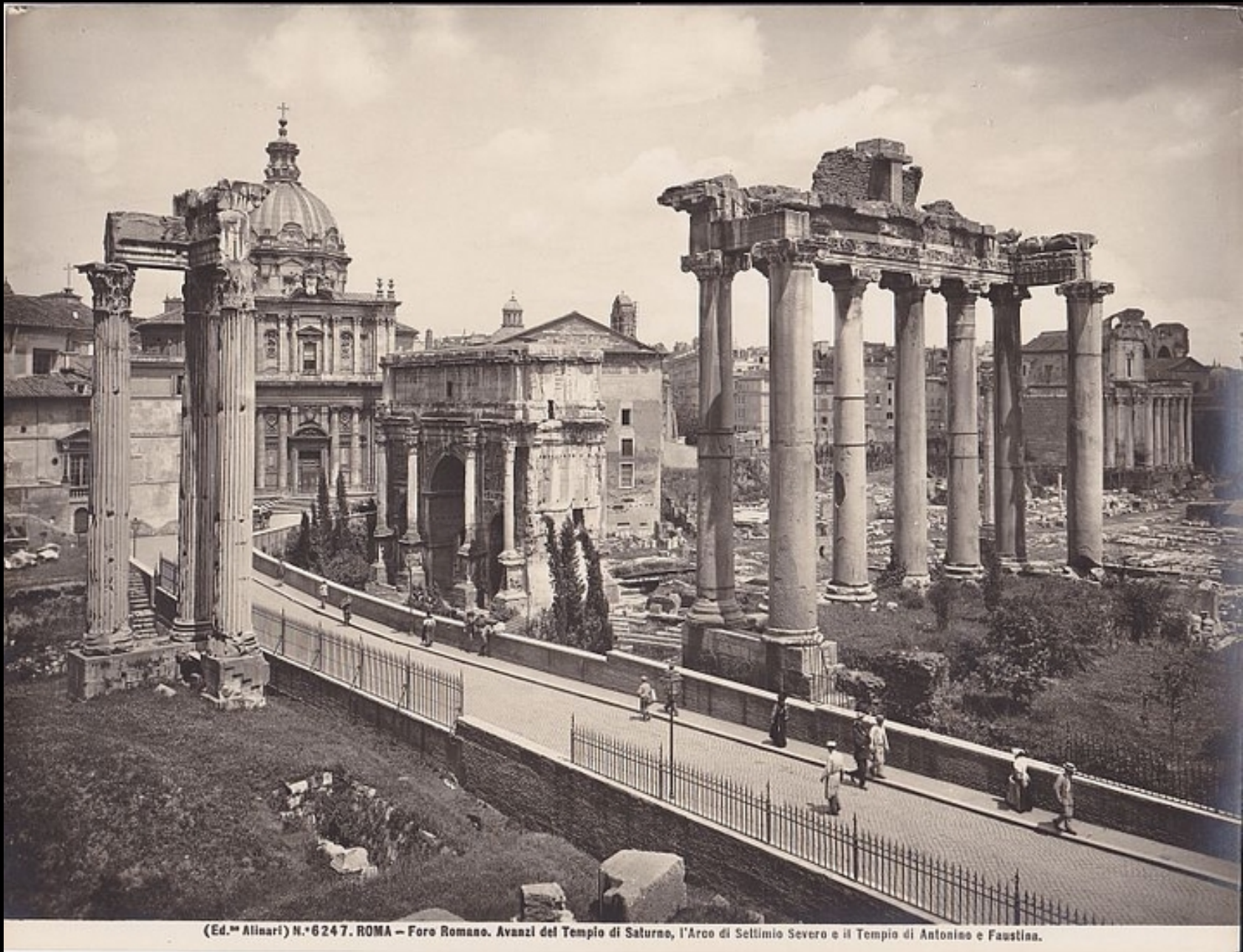
N.° 6247. ROMA — Foro Romano. Avanzi del Tempio di Saturno, l'Arco di Settimio Severo e il Tempio di Antonino e Faustina.