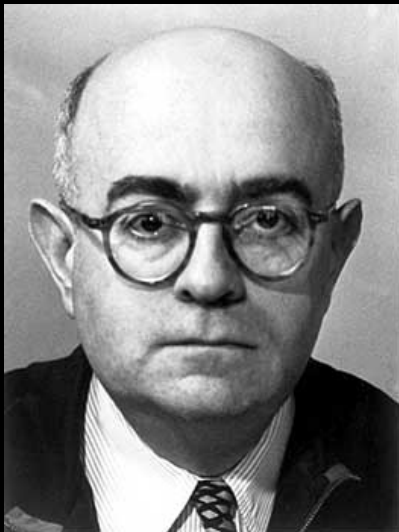
Theodor W. Adorno (Napoli)