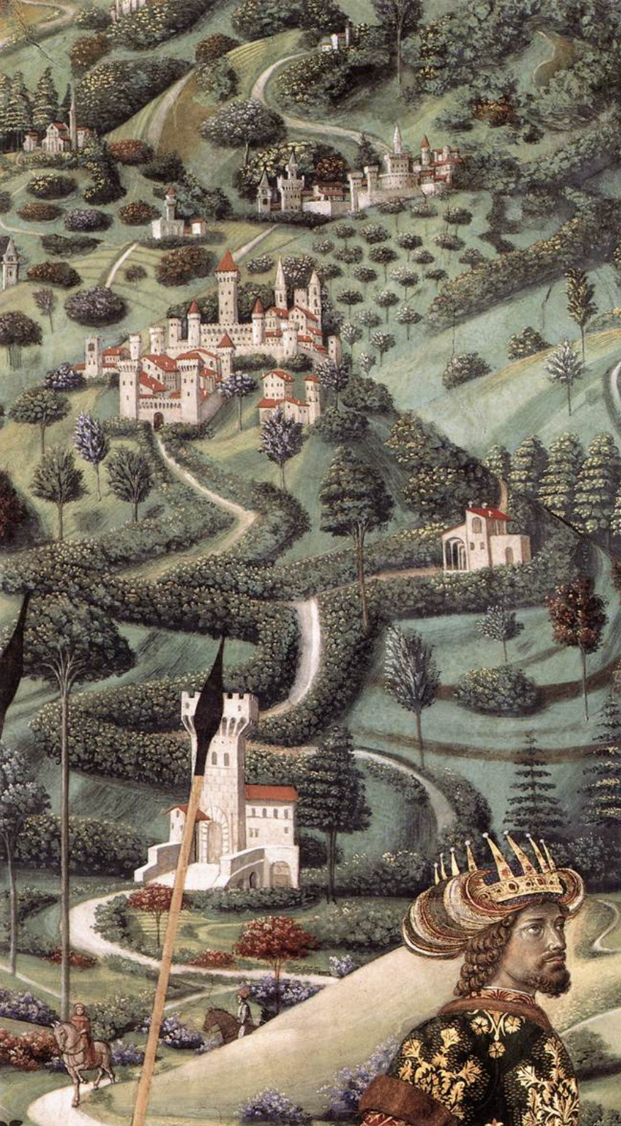
Benozzo Gozzoli, Processione dei Magi , part. (1459-1460, Palazzo Medici Riccardi, Firenze)