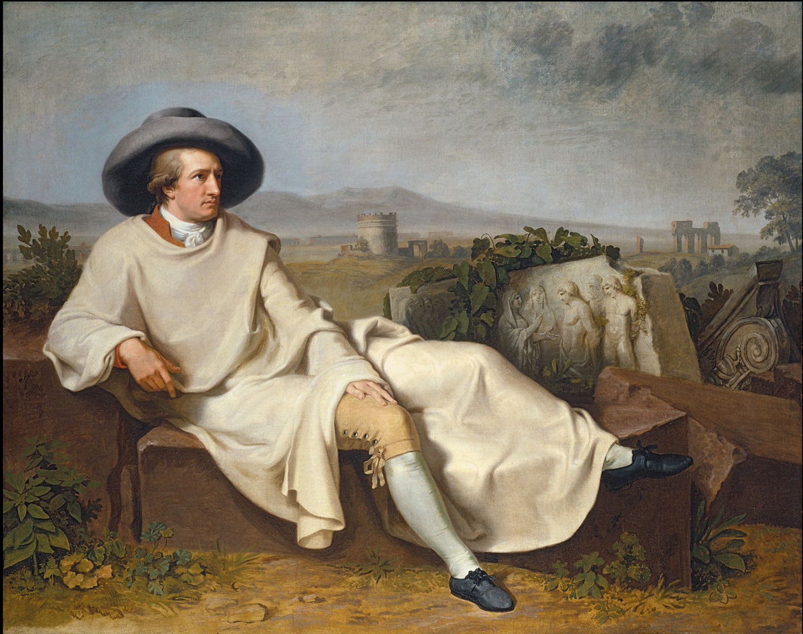
Johann H.W. Tischbein, Goethe nella campagna romana (1787, Städel Museum, Francoforte s.M.)