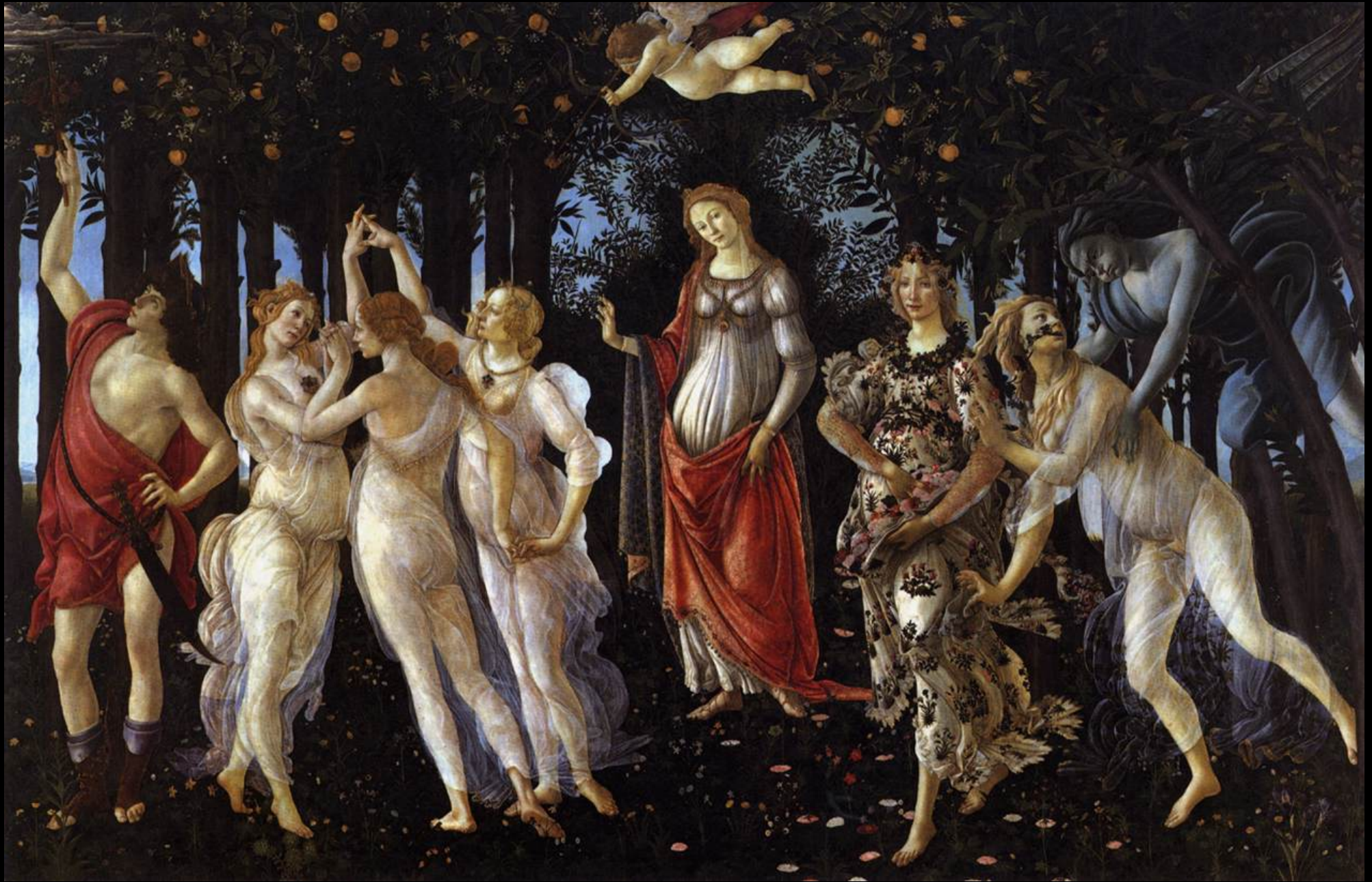
Sandro Botticelli, Primavera (c. 1482, Galleria degli Uffizi, Firenze)