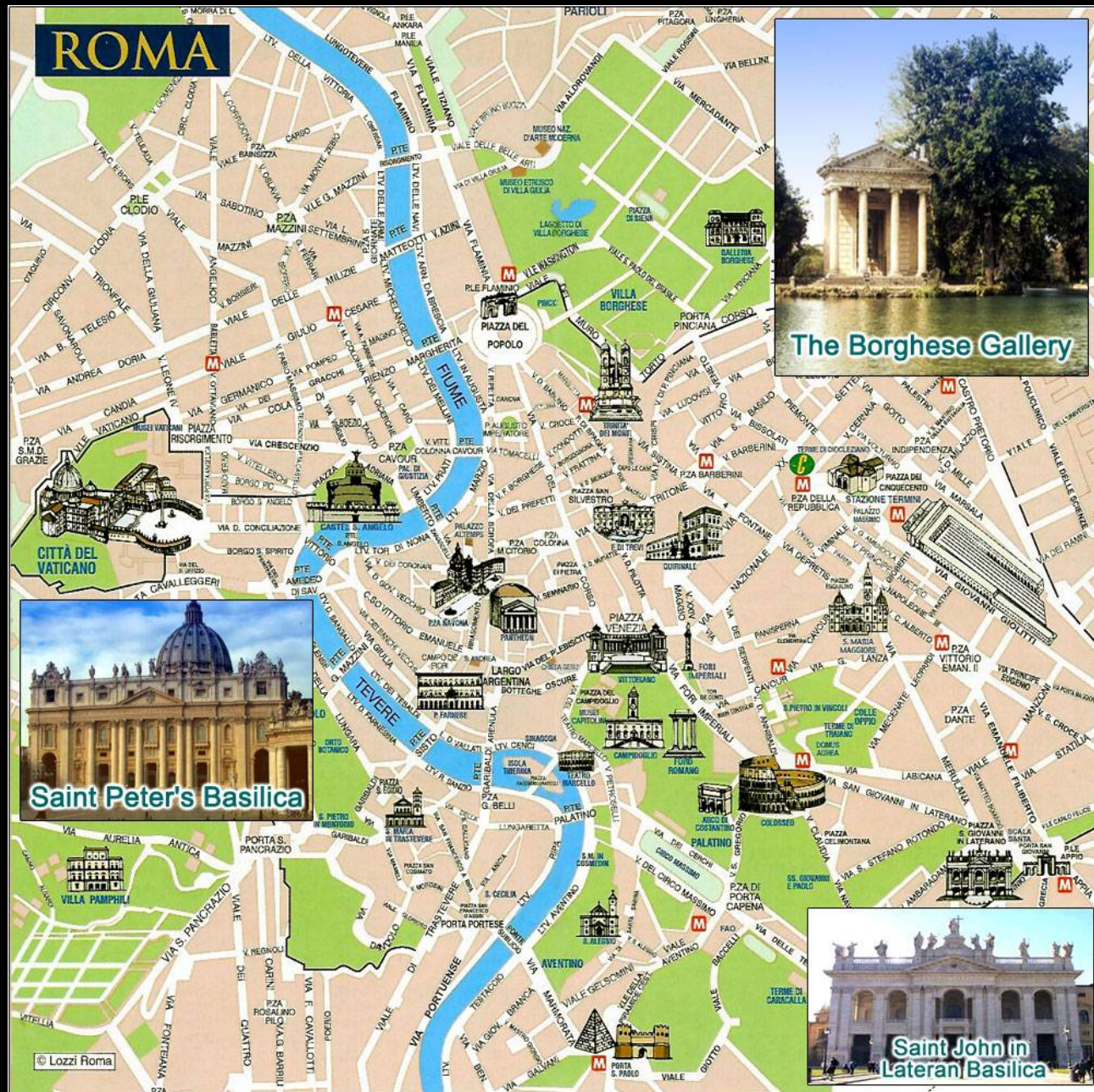
Roma, mappa con l'indicazione delle principali attrazioni turistiche