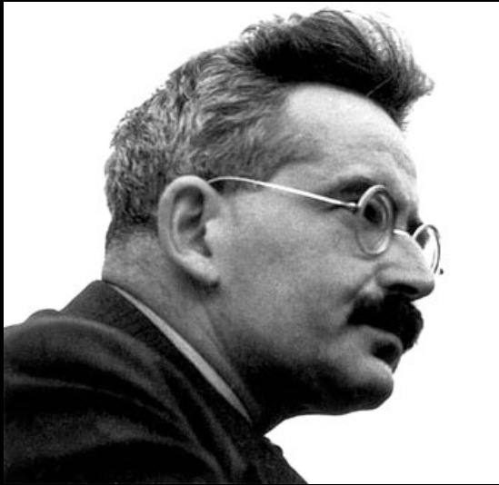
Walter Benjamin (Parigi, Berlino, Mosca, Marsiglia, S. Gimignano, Napoli)