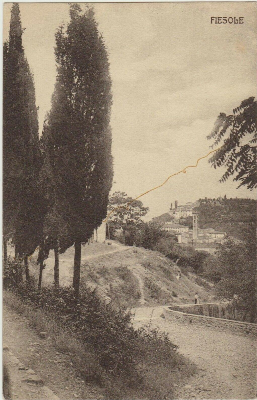
Fiesole (primi Novecento?)