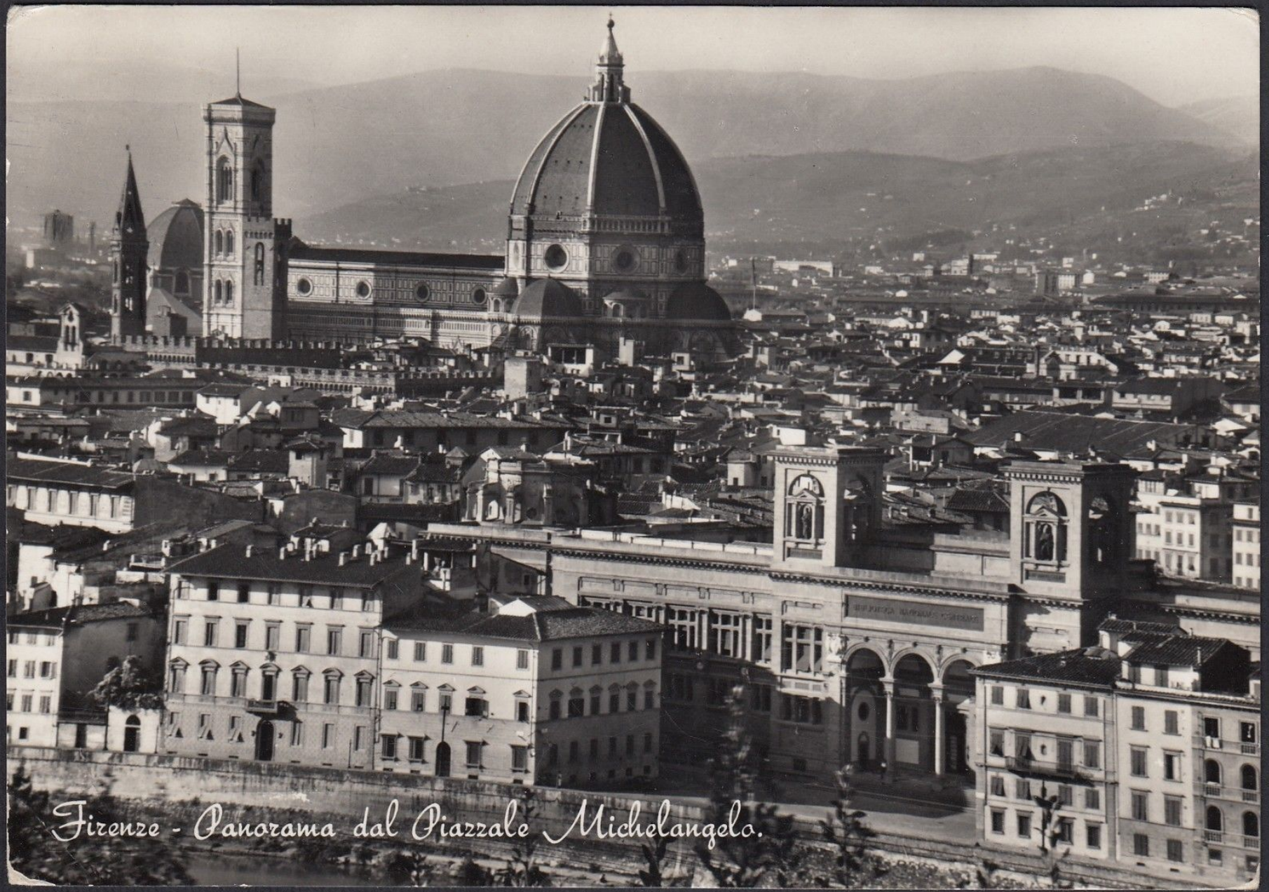
Firenze - Panorama dal Piazzale Michelangelo.

Firenze, panorama da Piazzale Michelangelo. Sullo sfondo, i «monti brulli» (cartolina d'epoca)