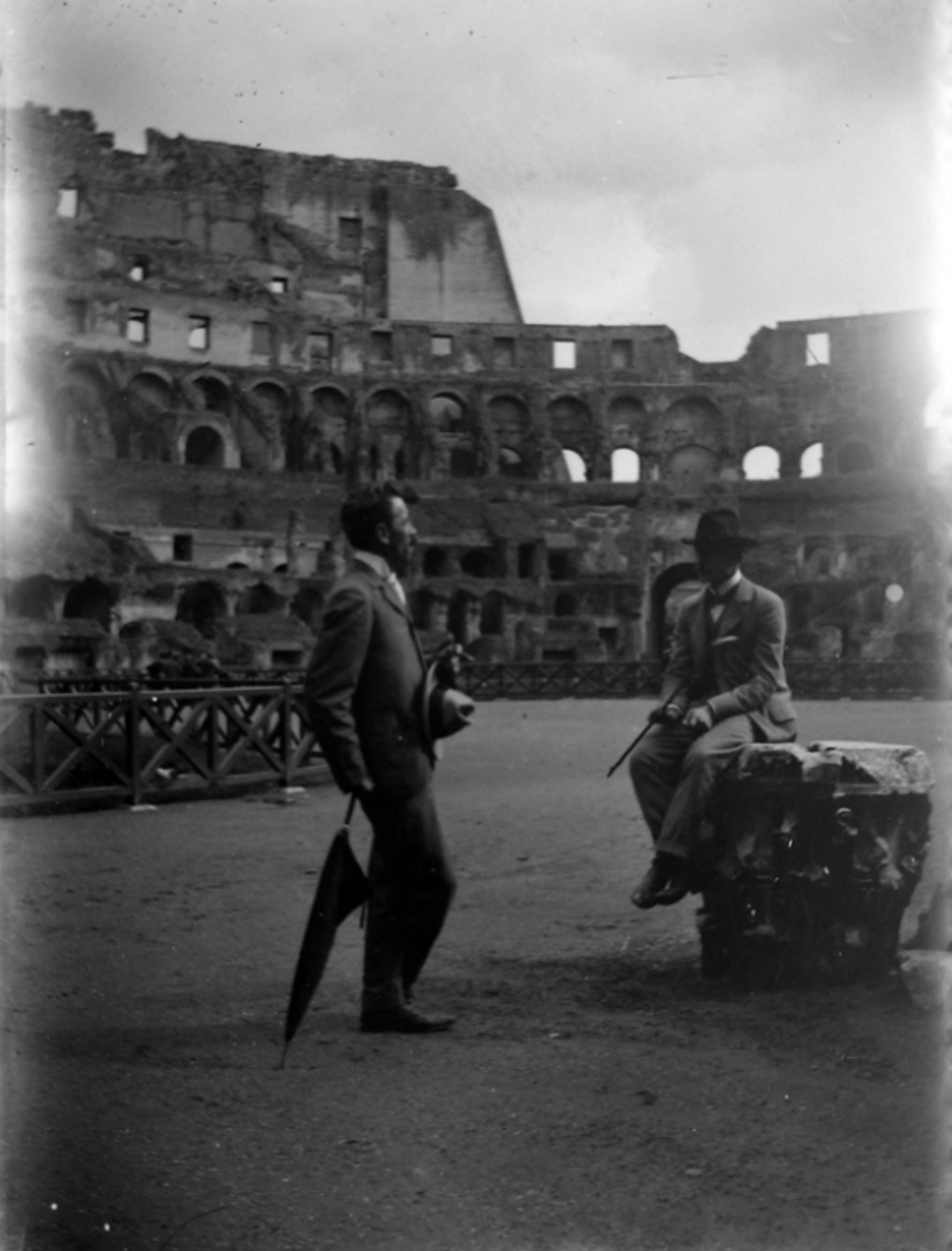
Roma, Colosseo, interno (c. 1900)